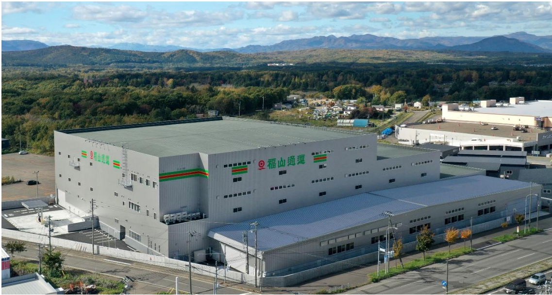
(北海道北広島支店)