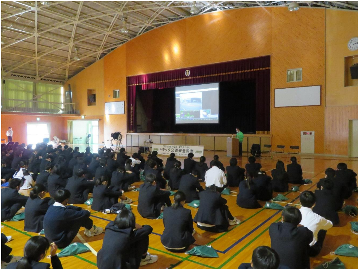
(ドライブレコーダーを使用した危険予測)