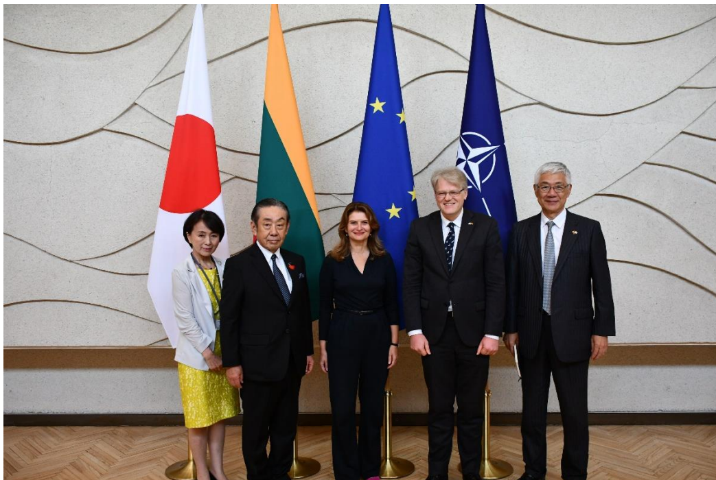
(左から小丸社長夫妻、リトアニア共和国 官房長官 ギエドレ・バウチーティエ様、駐日本リトアニア共和国 特命全権大使 オーレリウス・ジーカス様、在リトアニア日本国大使館 特命全権大使 尾崎 哲様)