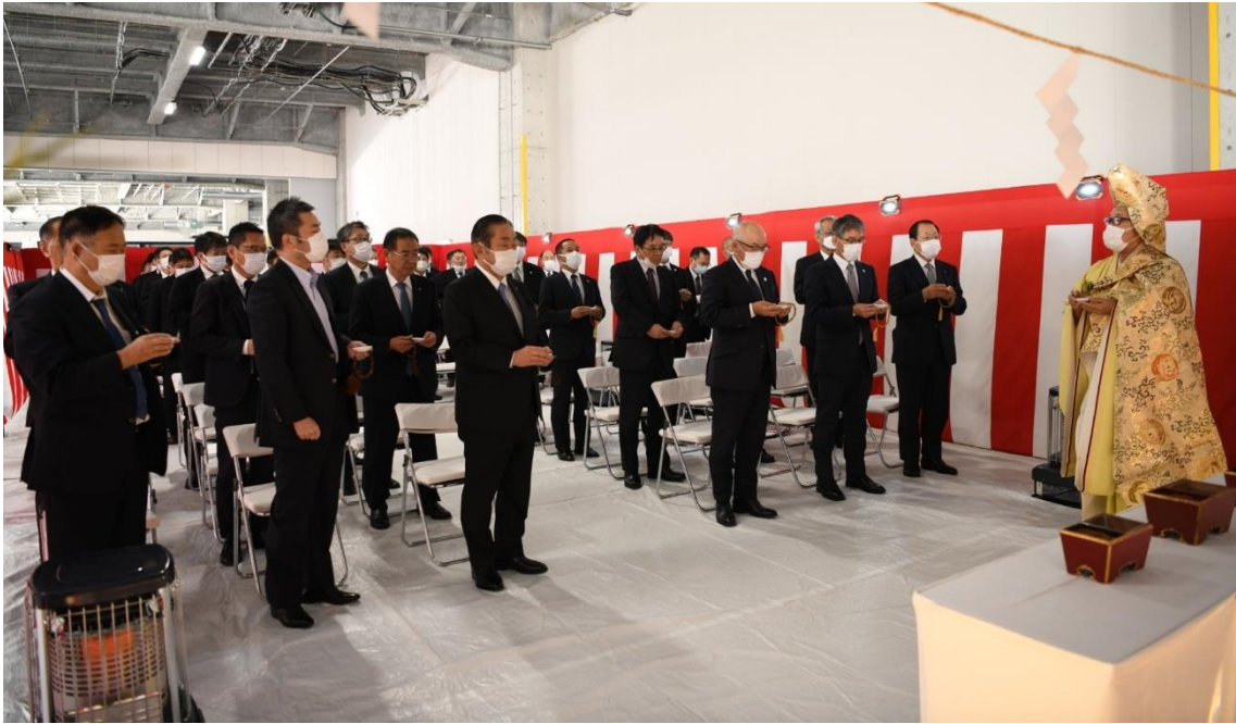
(東京主管支店ターミナル棟5階増設工事竣工式の様子)