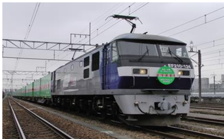
※福山レールエクスプレス号(東京タ～吹田タ間、東京タ～東福山間運行)