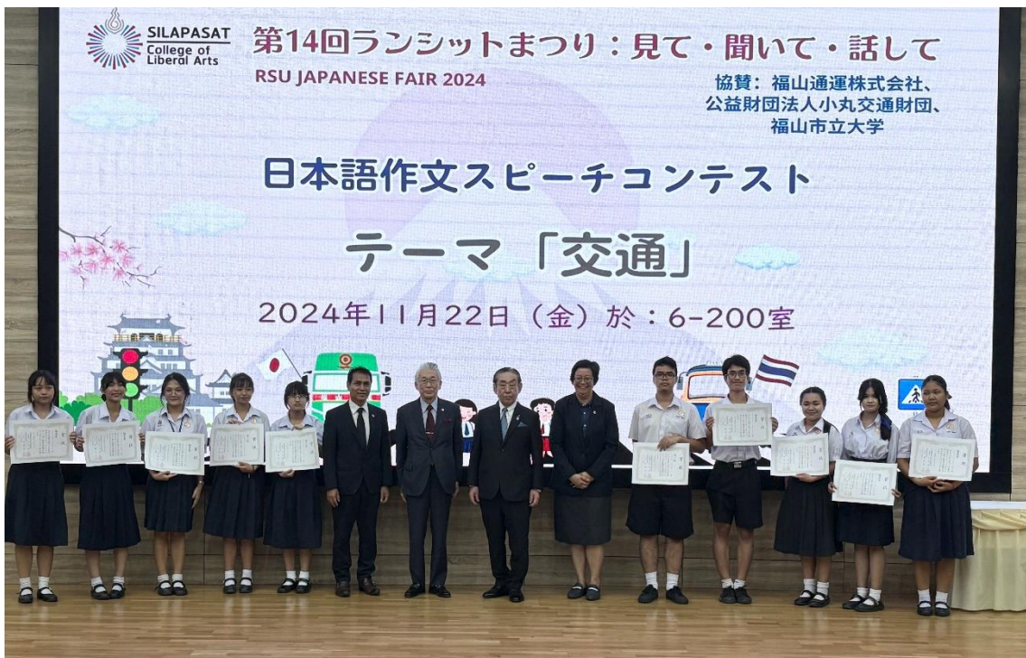
(タイ王国 第2回日本語作文スピーチコンテスト会場)